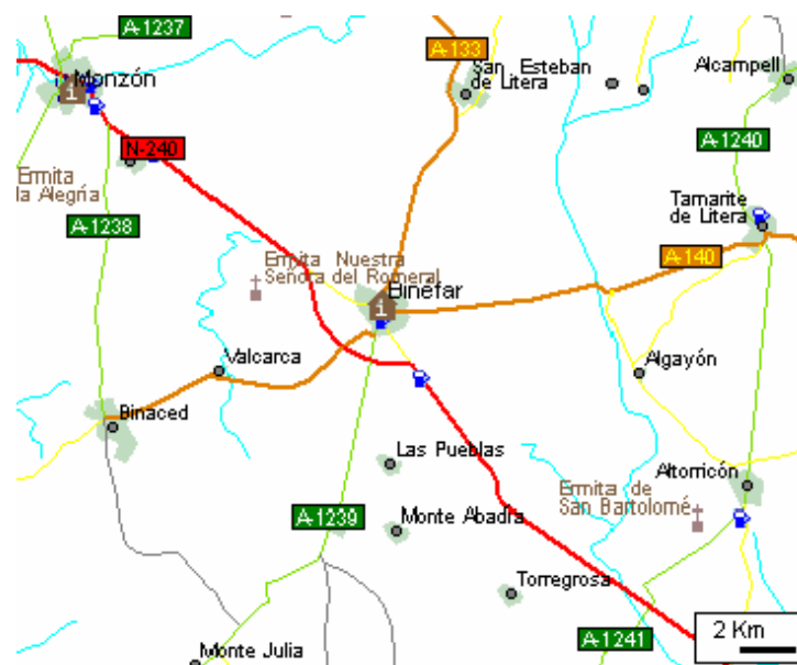
Ilustración 1: Mapa de Carreteras

La conexión de Binéfar con el resto de municipios limítrofes del entorno y comarca se consolida a través de una red radial de carreteras con centro en el núcleo urbano.