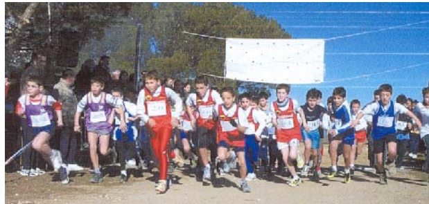
El popular Cross de San Quílez acogió este año 130 participantes

El Consejo Municipal de Deportes gestiona y coordina las escuelas deportivas y uso de las instalaciones municipales.