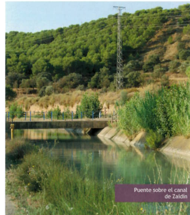
Puente sobre el canal de Zaidín

El pueblo de Binéfar hizo el voto de visitar desde entonces a la Virgen del Romeral, venerada en la Ermita de San Quílez, todos los primeros de mayo para agradecerle su misericordia y festejar el inicio de la tradicional época de lluvias.