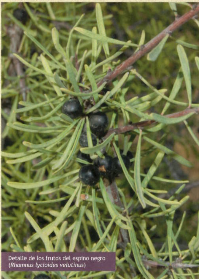
Detalle de los frutos del espino negro ( Rhamnus lycioides velutinus )

El Camino Natural de la Sierra de San Quílez está situado en la provincia de Huesca, en la comarca de La Litera. Comienza en la localidad de Binéfar y continúa durante unos ocho kilómetros hasta el Canal de Zaidín. El itinerario discurre por dos ramales que actúan como eje de comunicación entre los puntos de interés más destacados de la comarca e invita al viajero a descubrir la rica biodiversidad de esta comarca agrícola.